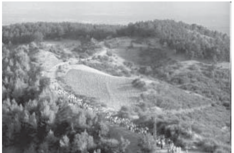
Plataci: la Madonna scende dal Monte

Francavilla Marittima , dove si è svolto un concorso canoro per nuovi talenti. Mi fermo presso il Mulino Cimminelli di Montegiordano , un vecchio compagno di scuola mi offre un caffè e mi sorprende con un fatterello di "scatole cinesi": "Purtroppo, nel palazzetto municipale c'è un po' di maretta. Non solo tra maggioranza del riconfermato sindaco ing. Francesco Lamanna e la minoranza del