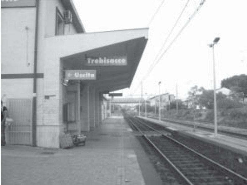
Stazione: Foto giu/ri

Qualcuno vi ha scritto un libro. Altri vivono sulla propria pelle un paese che si sta svuotando e spopolando. Le cifre la dicono lunga: una popolazione che all'anagrafe risulta di circa 9500 abitanti e che di anno in anno diminuisce sempre di più. Nella realtà, non ne conta più di 7500, perché molti, di fatto, non abitano più qui se non per brevi periodi delle ferie. Si parla di oltre mille giovani che hanno lasciato il paese per lidi più propizi, come Bologna, Milano o altre città del Nord. Tasso di disoccupazione al di sopra delle due cifre; uffici che prendono il volo verso zone più idonee; scuole che si svuotano; abitazioni con cartelli ai portoni con su scritto "vendesi"; negozi che spariscono; chiusa la sede della Comunità Montana; chiusa la linea ferroviaria Crotone-Milano.